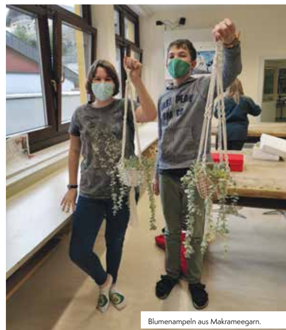
Blumenampeln aus Makrameegarn.