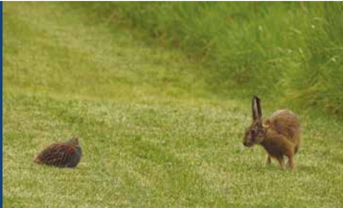
Feldhase und Rebhuhn