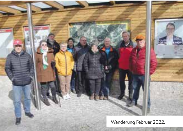
Wanderung Februar 2022.