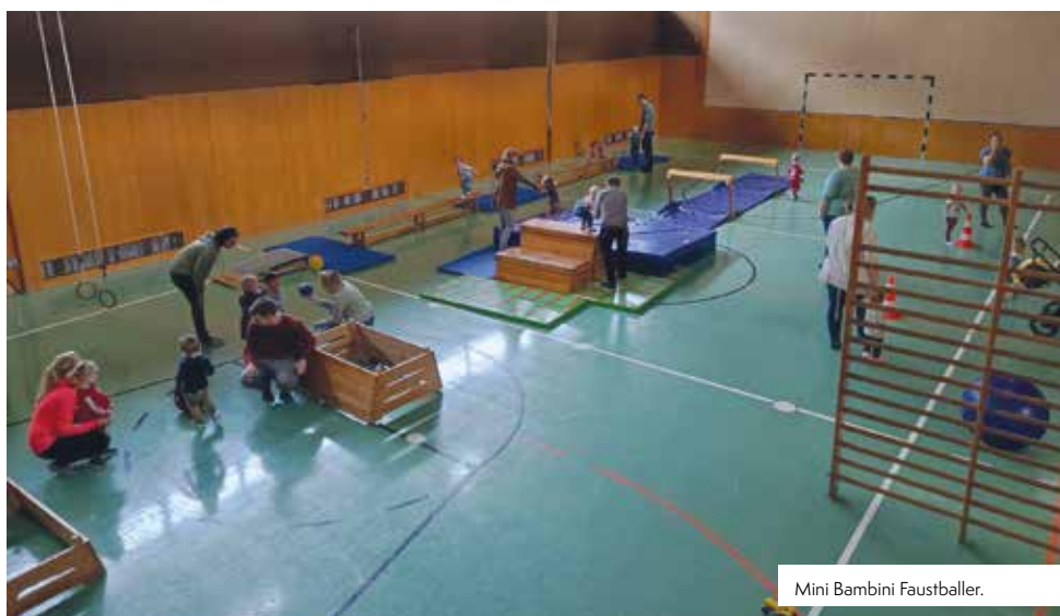
Mini Bambini Faustballer.