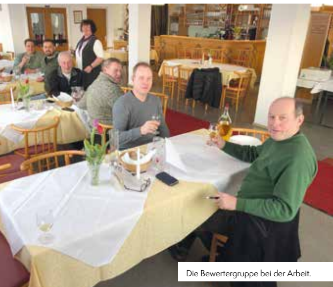
Die Bewertergruppe bei der Arbeit.