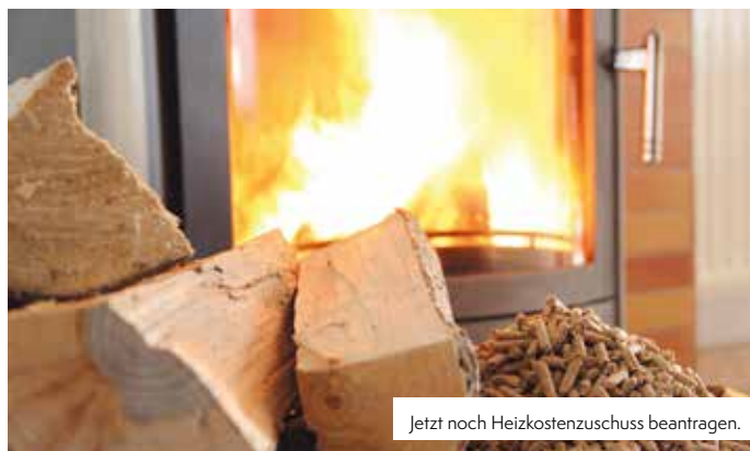
Jetzt noch Heizkostenzuschuss beantragen.

Für sämtliche Anträge gelten die Einkommensverhältnisse des Jahres 2021. Der Antrag kann bei der Gemeinde gestellt werden.