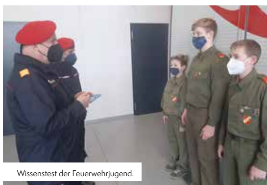
Wissenstest der Feuerwehrjugend.