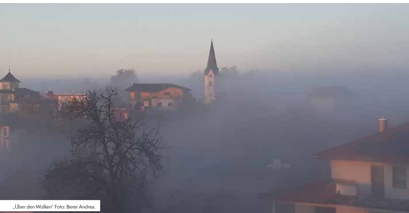
„Über den Wolken“