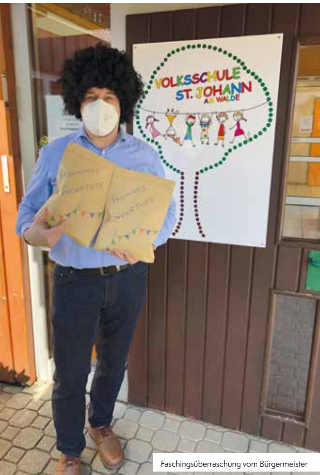
Faschingsüberraschung vom Bürgermeister