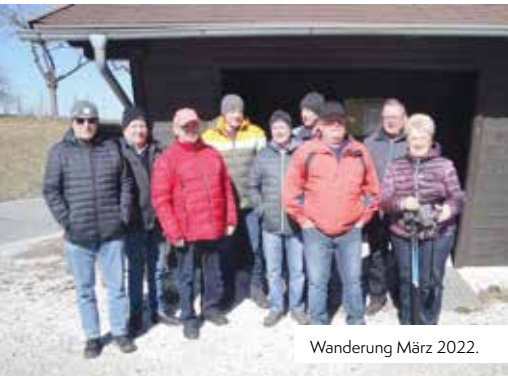
Wanderung März 2022.