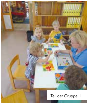
Teil der Gruppe II

Die meisten Kinder haben sich gut in den Kindergartenalltag eingelebt und schon feste Freundschaften geschlossen! Unser heuriges Kiga-Jahr steht unter dem Motto „ BAUERNHOF “.