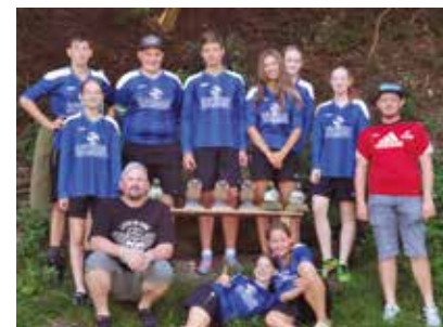
U16 Mannschaft bei der Bezirksmeisterschaft