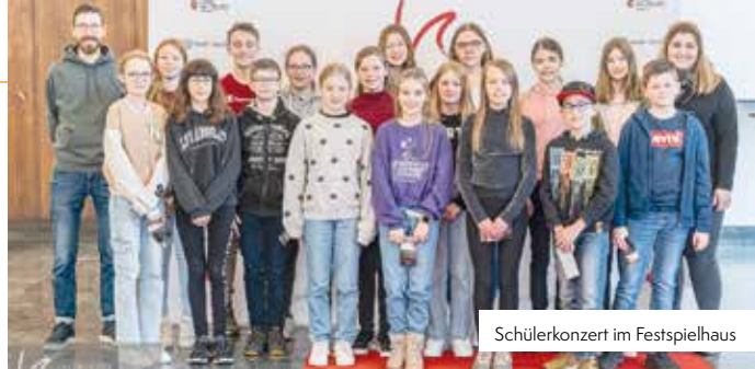
Schülerkonzert im Festspielhaus