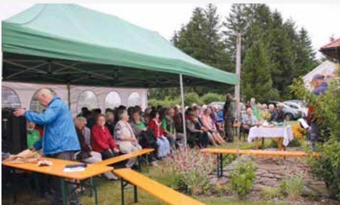
Feldmesse bei der Tomerlbauer Kapelle